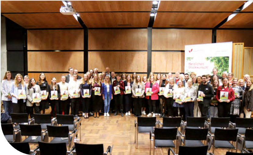
Die Stipendiat*innen und Fördernden bei der Vergabefeier 2024